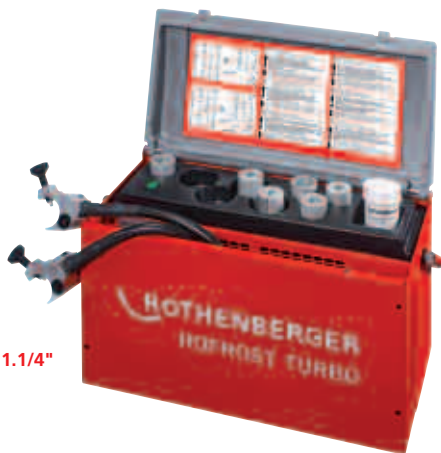
ROFROST TURBO 1.1/4" No. 6.2200