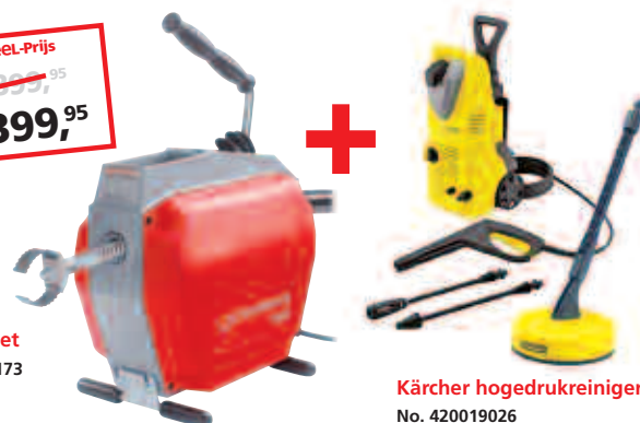
R600 Set No. 1.9173