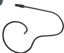
Moduul Pipe TEC 10 / 1.5