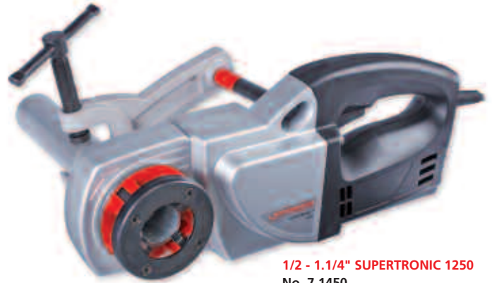
1/2 - 1.1/4" SUPERTRONIC 1250 No. 7.1450