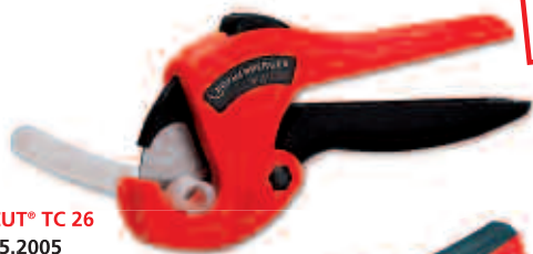
ROCUT® TC 26 No. 5.2005