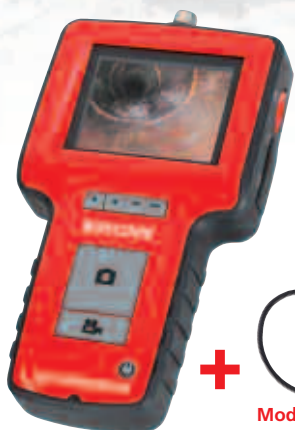
ROSCOPE PIPE 25 / 22