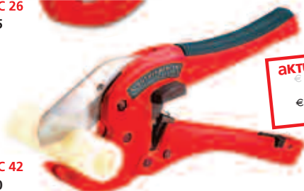
ROCUT® TC 42 No. 5.2000