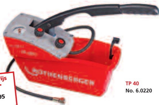
TP 40 No. 6.0220