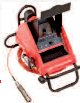
ROCAM® mobile PDM No. 6.9626